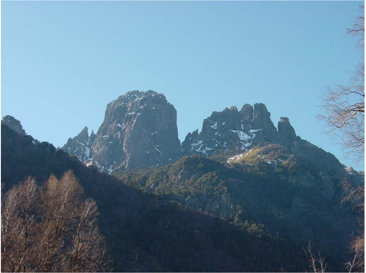
fast wie in den Dolomiten