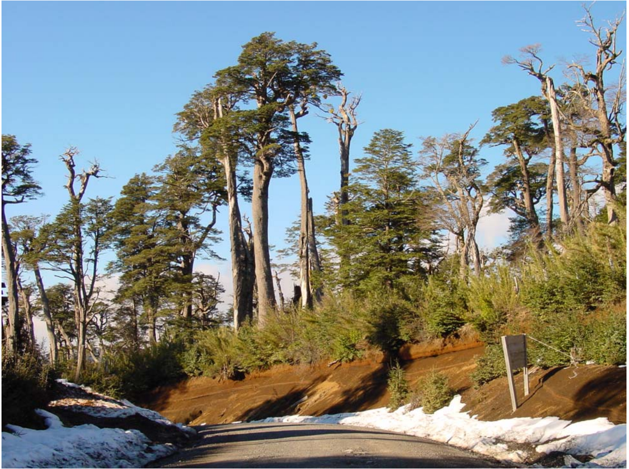
auf der Strasse zum Skigebiet knorrige Wälder und holprige Strassen...