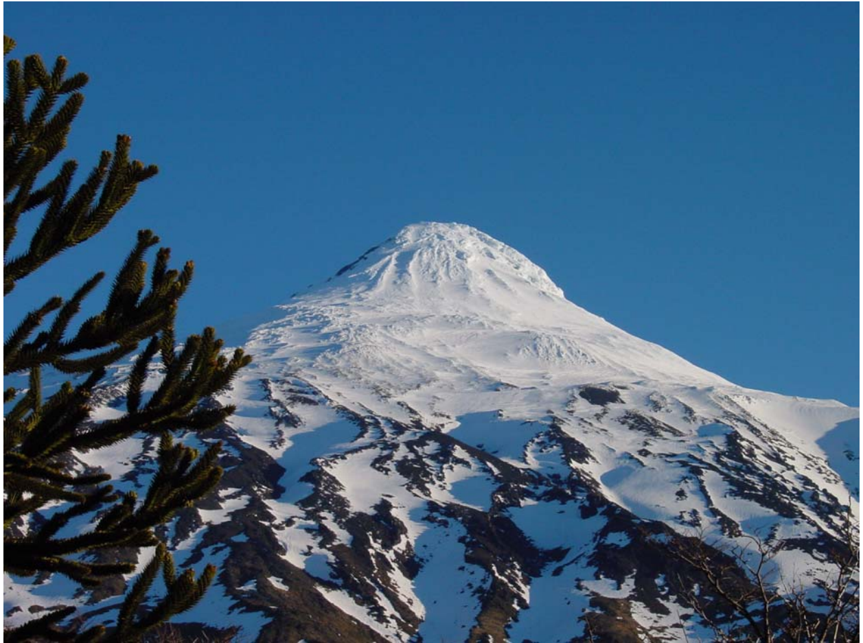
Der Vulkan Lanin auf dem Pass