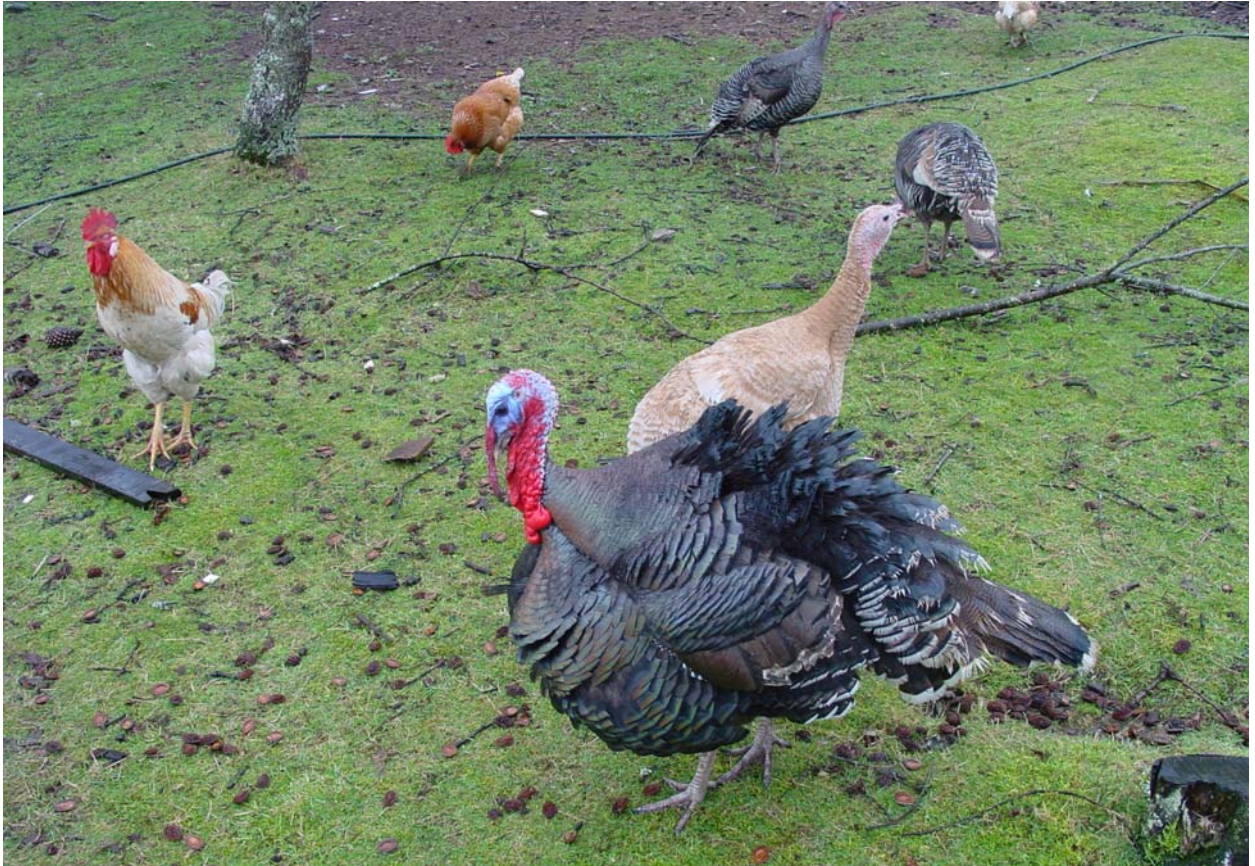
Federvieh in Hülle und Fülle...