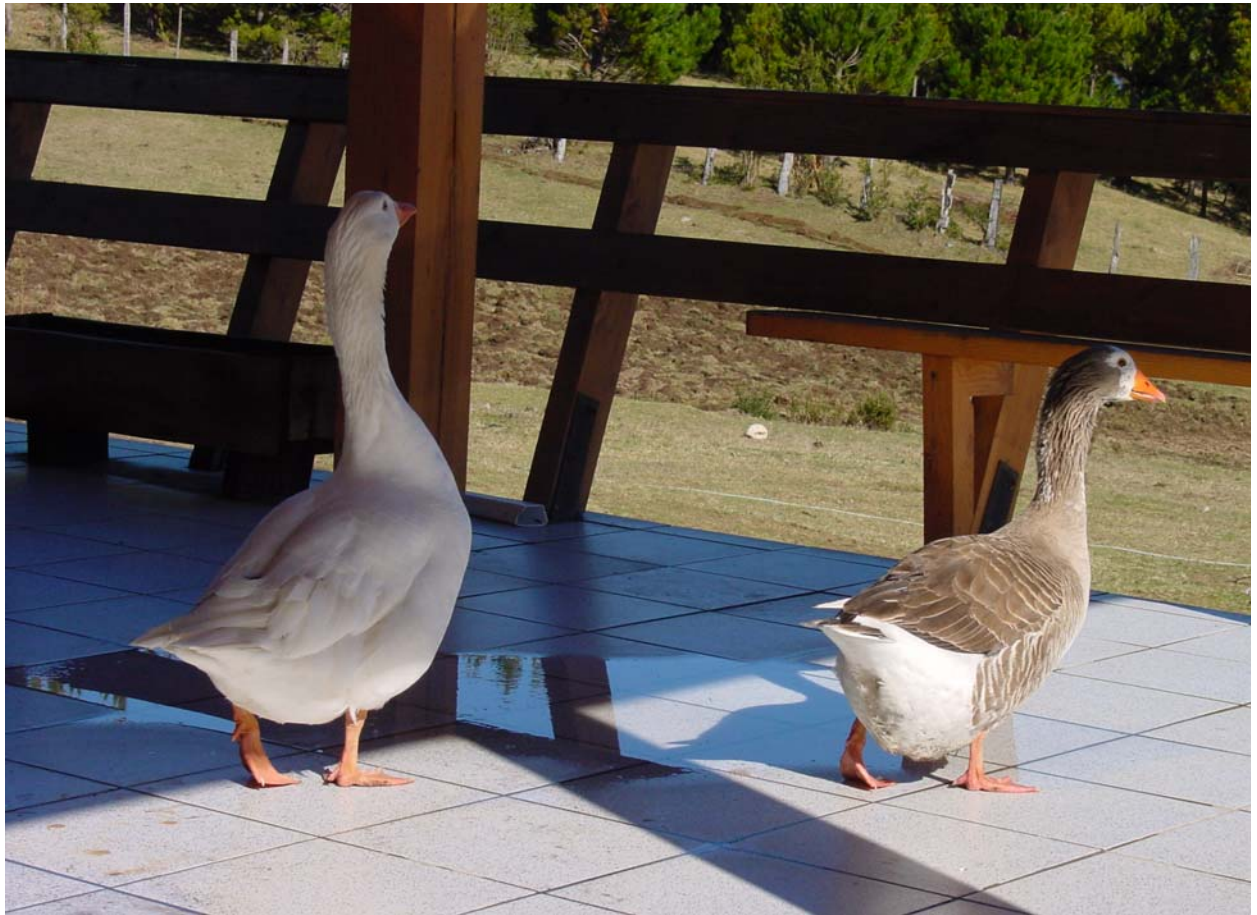
die Gänse auf der Terrasse