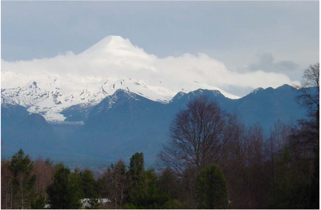
Aussicht bei schönem Wetter... der Vulkan Villarica!