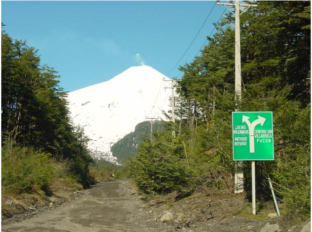
die Strasse hoch zum Skigebiet....