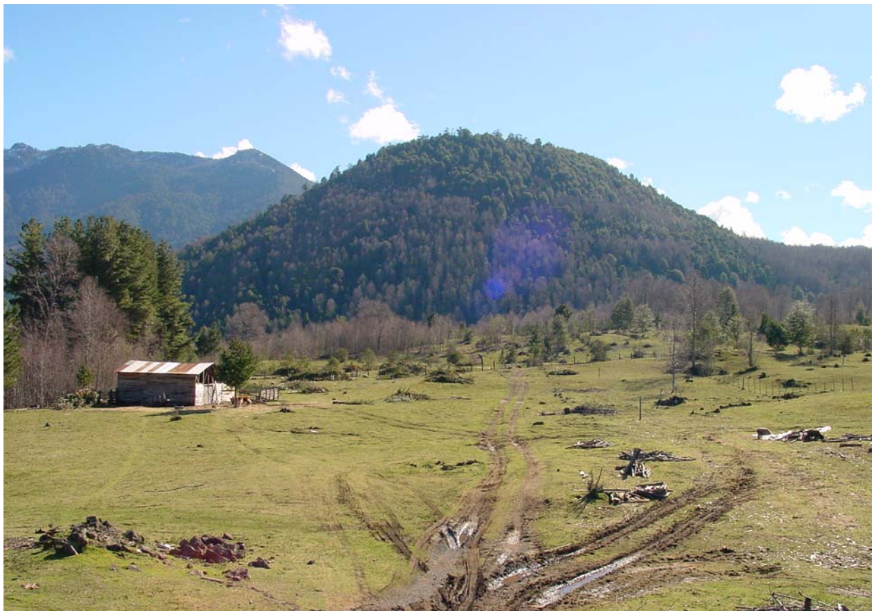
Paul's Vulkan (erloschen und bewaldet)