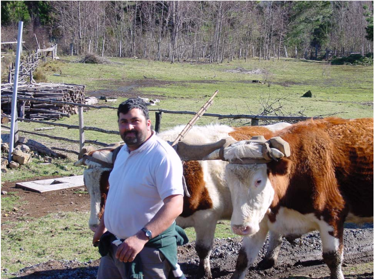
...an die Arbeit.....