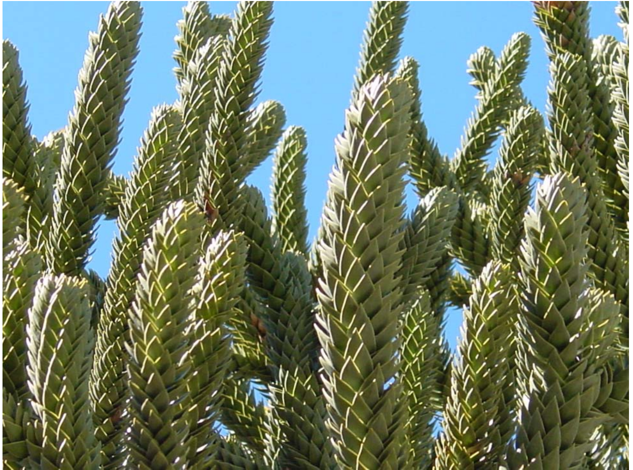
die Araukarien (Andentannen) - Frucht kann man essen... ist aber erst im März/April reif